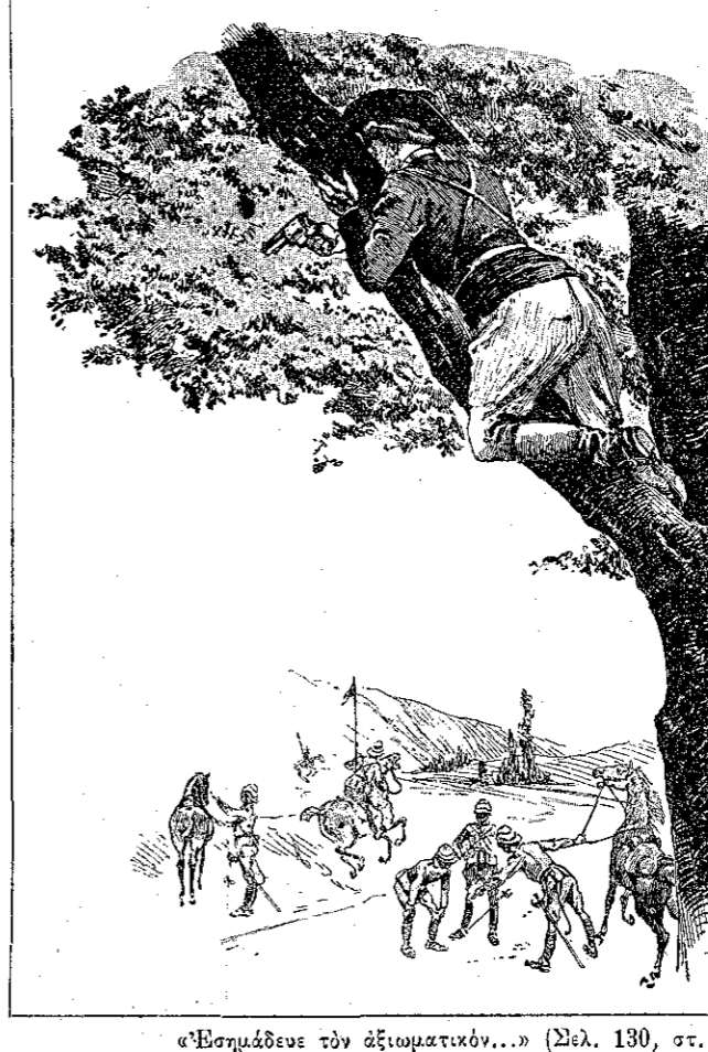
Ἐσημάδευε τὸν ἀξιωματικόν... (Σελ. 130, στ. γ')

Οἱ Μπόερς εἶχαν ὀρμίσῃ πρὸς τὸ μέρος ἐκεῖνο ἐν σώματι, μὲ τὰ τουφεκία των ἐτοίμα, ἀλλὰ τὸ ἀερόπλοιο ὕψωσε τὴν λευκὴν σημαίαν, καὶ ἔτσι ἐκρατήθησαν καὶ δὲν ἐπυροβόλησαν. Ὅταν ὁ Γιάγκος ἐπάτησεν εἰς τὴν γῆν, ἡ φωνὴ τοῦ Ζουαντικ ἠκούσθη, τρέμουσα, γε-