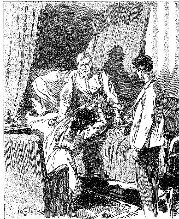
«Τρελλή! τρελλή βέβαια θά είσαι...» (Σελ. 145, στ. α'.)

Δυστυχῶς μετὴν ἔξαψιν ποῦ εἶχεν, ἡ Ἄνδρῆ δὲν ἀντελήφθη τὴν κίνησιν τοῦ ἐξαδέλφου της. Μετὰ ταῦτα καὶ σπασμαδικὸν βῆμα διέβη τὸ δωμάτιον, ἔξηλθε καὶ ἐβρόντησεν ὀπίσω της τὴν θύραν, καθὼς τὴν ἔκλεισεν. Ἄμα ἐπέστρεψεν εἰς τὸ δωμάτιόν της, ἐκλείσθη ἐκεῖ μὲσα, διὰ νὰ ξεφύγῃ ἀπὸ ὄλων τὰ βλέμματα καὶ νὰ καλοσκοπήσῃ τὴν ἐλεεινὴν της πράξιν. Τί δὲν θά ἔδιδε τώρα, διὰ νὰ ἐκμυθηνίσῃ τὰ ἀπαίσια συμβάντα αὐτῆς τῆς τελευταίας ὥρας καὶ νὰ ἐξαλείψῃ καὶ τὴν ἀνάμνησιν των ἀκόμη! Τώρα πλέον, ἐσκέπτετο, θά ἦτο ἀντικείμενον φρίκης διὰ τὸν πατέρα της, τοῦ ὁποῖου ὁ εὐθύς καὶ ἐντιμὸς χαρακτήρ ἀπεστρέφετο πᾶν ὅ,τι ἦτο ψεῦδος, ἀπάτη, διπροσωπία. Καὶ