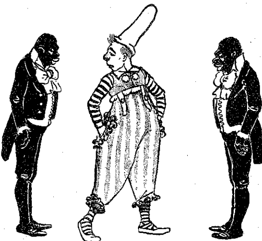
«Μπιταῖς... Όταμπής;...» (Σελ. 140, στ. β').

Κ' ἐμεθοῦσε τόσο ἀγρία ὁ Καραμπάμπουλας, ὥστε μιά ἡμέρα ἐσήκωσε τὸ τομπούκι του νὰ σπᾶσῃ τὸ κεφάλι τοῦ Όταμπῆ. Φυσικᾶ ἔσπασε τὸ τομπούκι καὶ ὄχι τὸ κεφάλι, ὁ Όταμπής ὅμως ἐπῆρε τόση τρομάρα, ὥστε ἐσηκώθη κ' ἔφυγεν ἀπὸ τὸ βασιλεῖον τοῦ Καραμπάμπουλα, χωρὶς κἀν νὰ υποβάλῃ προτῆτερα τὴν παραίτησίν