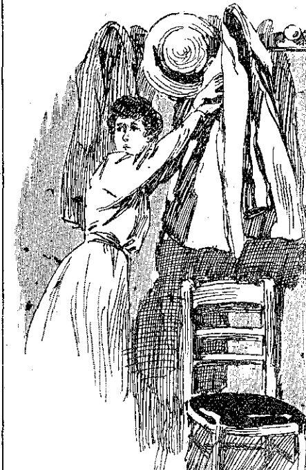
«Εἰς μίαν τσέπην τοῦ ἐνδύματος...» (Σελ. 141.)

Ἡ καρδιά τῆς Ἄνδρας ἤρχισε νὰ κτυπᾶ δυνατὰ. Θὰ ἐγίνοντο λοιπὸν ὅλα ὅπως τὰ εἶχε προβλέψῃ ἡ φρενιασμένη